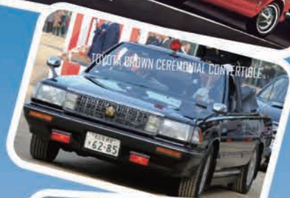
TOYOTA CROWN CEREMONIAL CONVERTIBLE