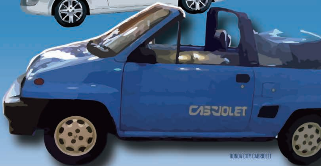
HONDA CITY CABRIOLET