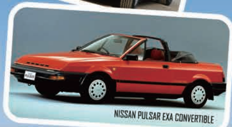
NISSAN PULSAR EXA CONVERTIBLE