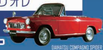
DAIHATSU COMPAGNO SPIDER

さまざまな国、スタイルのオープンカー 爽快で開放的なイメージをもたらす車を会場に集結！ コロナ禍でただよう閉塞感を打破する楽しさを 4人乗りのスタイルにこだわりお届けします。