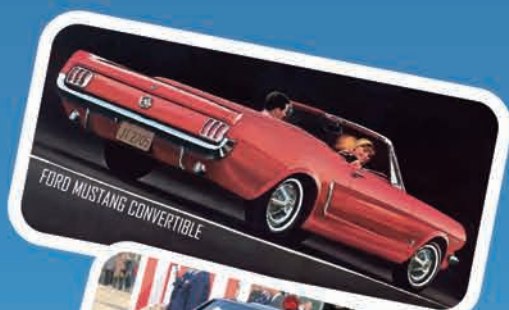
FORD MUSTANG CONVERTIBLE