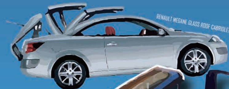
RENAULT MEGANE GLASS ROOF CABRIOLET