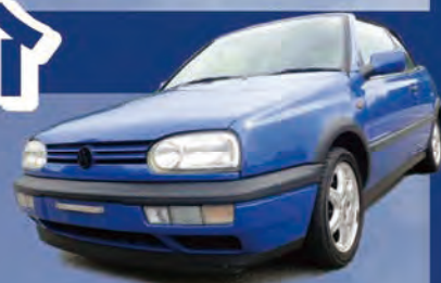
フォルクスワーゲン ゴルフ カブリオ Volkswagen Golf Cabrio, 1996